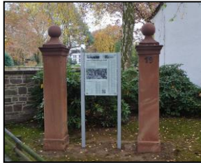
Infotafel jüd. Friedhof