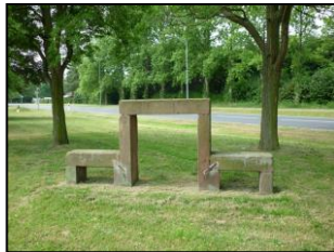
Ruhe (Offenbacher Str.)